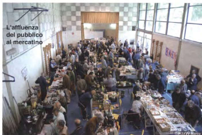
L'affluenza del pubblico al mercatino