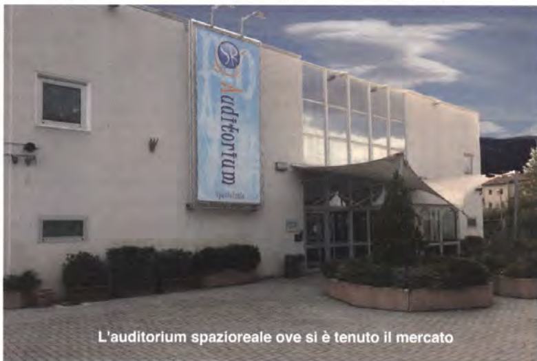
L'auditorium spazioso dove si è tenuto il mercato

Vicepresidente i saluti e le novità del nuovo Consiglio ARI Nazionale, i colleghi delle Sezioni ARI vicine a noi sul territorio che si sono affiancate alla nostra, i rappresentanti del Consiglio Regionale Toscana dell'ARI e gli amici e colleghi della Sezione ARI Firenze. Lo faccio a nome di tutti e per tutti, perché abbiamo avuto l'impressione che questa seconda edizione del Mercatino di Scambio di Firenze, sia stata l'ulteriore dimostrazione che il nostro hobby è ancora vivo. Ci sono iniziative che miglioreremo nella manifestazione del 2013,