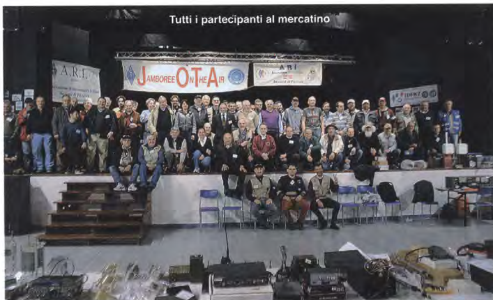
Tutti i partecipanti al mercatino

Questo il motivo di "grande soddisfazione" per tutti gli Organizzatori e sono sicuro che anche per tutti gli espositori ed avventori è stata la stessa cosa. Noi pensiamo che attraverso i Mercatini di Scambio, oggi, le persone possono tornare ad incontrarsi per riciclare e riutilizzare anche oggetti altrimenti destinati ai cassonetti dell'immondizia: è in queste occasioni che da magazzini, soffitte